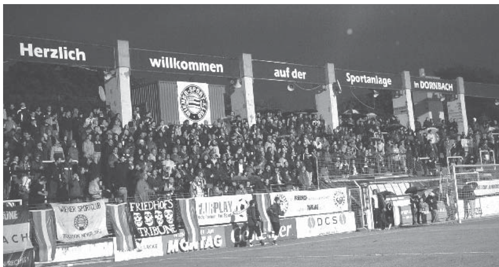
Impressum: Herausgeberinnen: FreundInnen der Friedhofstribüne, 1170 Wien, Döblinger Kojoten, 1190 Wien.